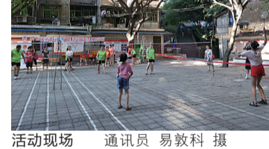
活动现场