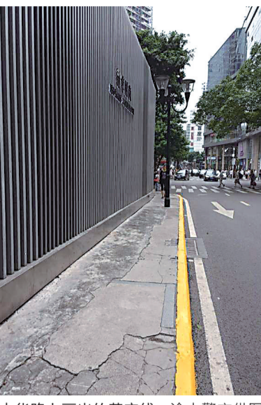
中华路上画出的黄实线