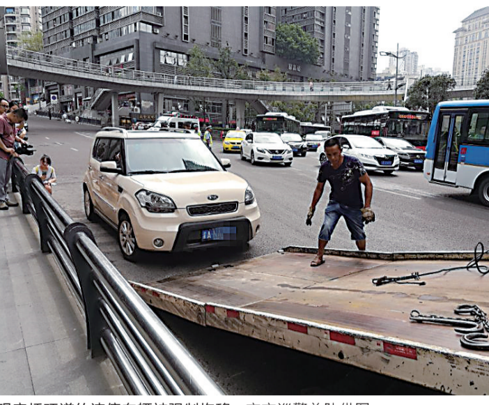
观音桥环道的违停车辆被强制拖移