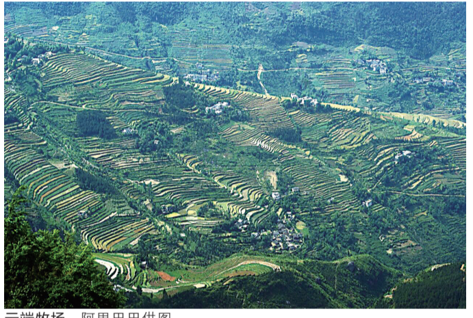
云端牧场