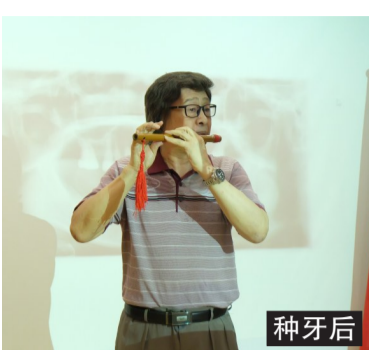
章教授种好牙能唱歌能吹笛子

“漏风”,完全没办法表演,缺牙的章教授决定不再参加文艺活动,变得郁郁寡欢。顾虑:“种牙怕疼怕折腾先忍忍” 专家说:忍出来的问题其实更多! 这两年章教授吃东西不利索,身体状况每况愈下,有人劝他做种植牙,可章教授