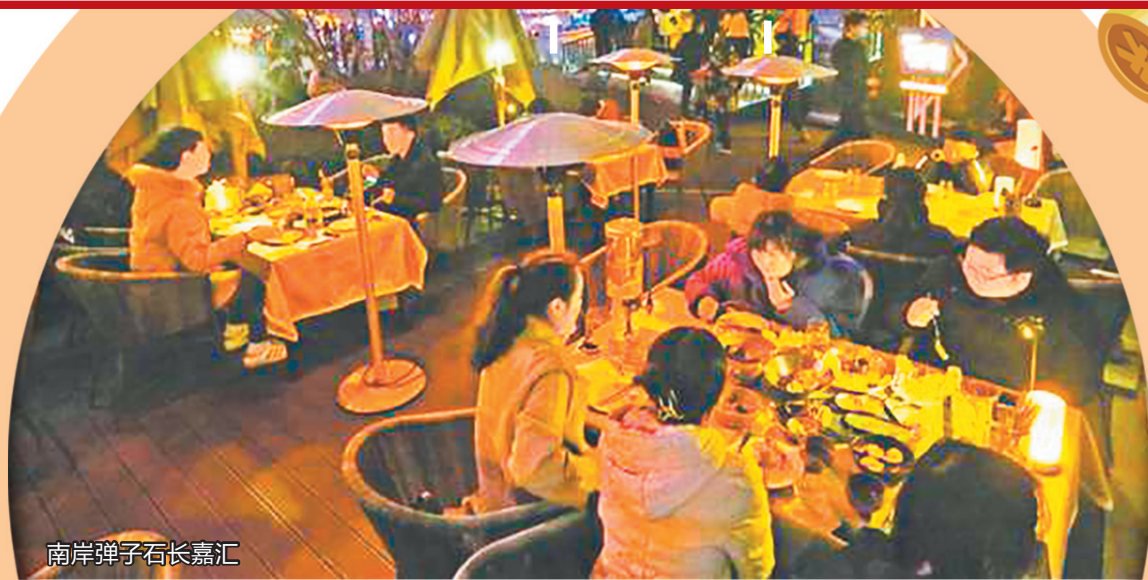
南岸弹子石长嘉汇