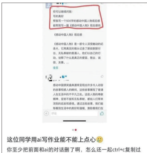
这位同学用ai写作业能不能上点心 你至少把前面和ai的对话删了啊,怎么还一起ctrl+c复制过