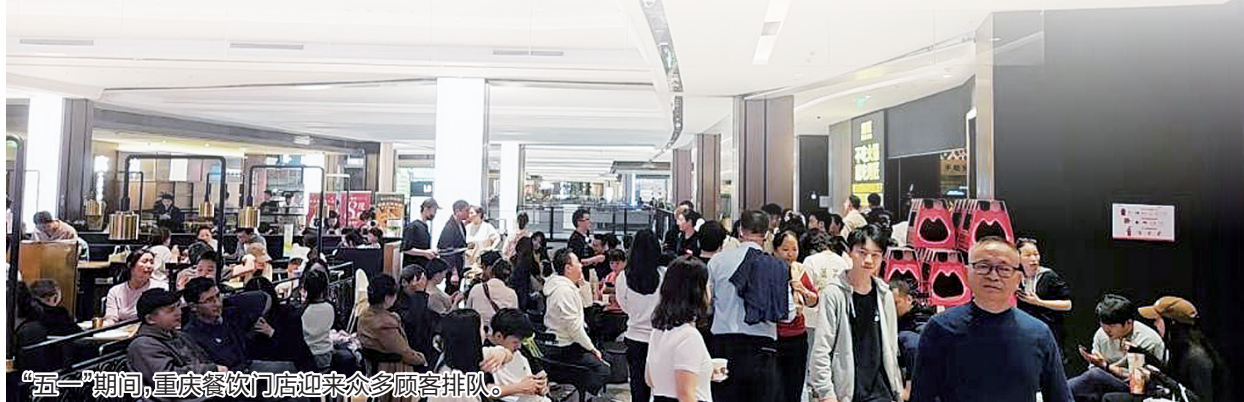
“五一”期间，重庆餐饮门店迎来众多顾客排队。