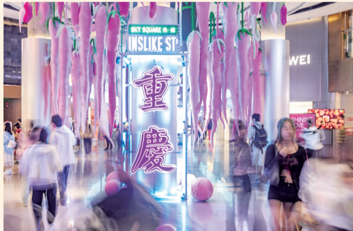
消费者在重庆市江北区观音桥商圈的方圆LIVE商场内购物游玩。