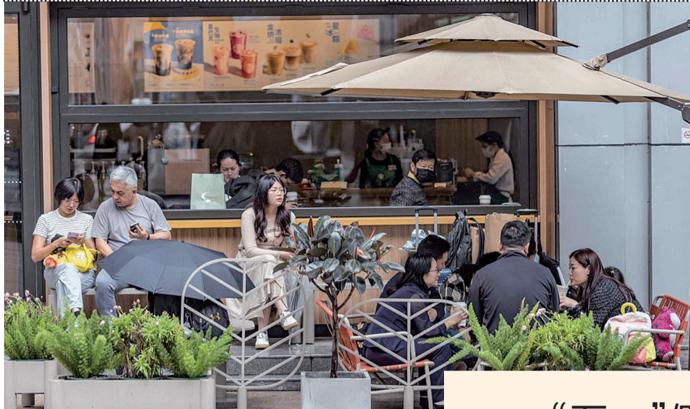
消费者在商场内的一家咖啡店休息