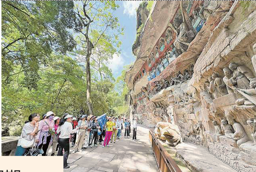
大足区宝顶山石刻景区游人如织