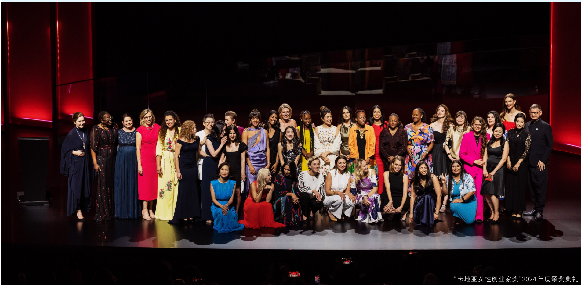
“卡地亚女性创业家奖”2024年度颁奖典礼

“卡地亚女性创业家奖”将以此特别的表彰方式,致力扩大影响力,强调长期承诺对以影响力为驱动的企业的重要性,同时突显可观的资金支持(每个奖项10万美金)及来自社群人脉的广泛支持,在培养她们的旅程中发挥的关键作用。