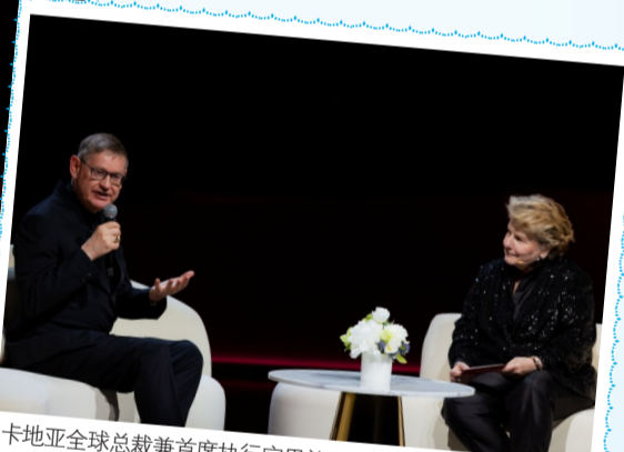
卡地亚全球总裁兼首席执行官思礼乐(Cyrille Vigneron)(左一)