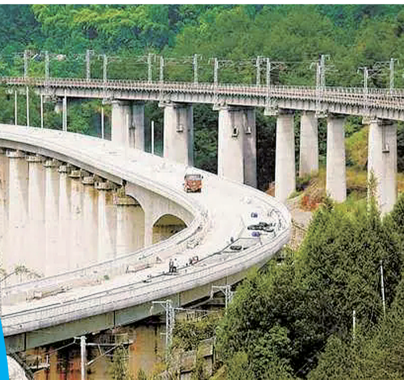
6月29日,渝湘高铁重庆至黔江段玉泉村特大桥加紧施工。

又如,位于万州的新田港铁路集疏运中心自2022年底投运后,来自达州瓮福集团的化肥集装箱经铁路运输直达新田港,乘坐集装箱班轮运抵长江口的港口中转,换乘海轮运抵辽宁营口港。由此一来,物流运费降低5%,物流运输时间缩短两天。