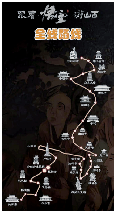
山西省文化和旅游厅视频号截图

联想与该游戏联名了两款PC端产品，分别为拯救者Y9000P AI元器件《黑神话：悟空》联名定制版、拯救者刃7000K超能版《黑神