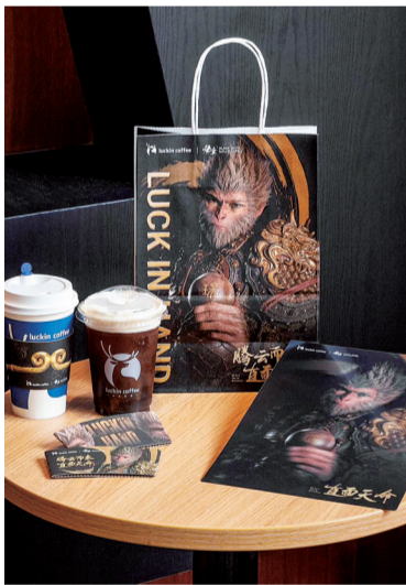
luckincoffee 瑞幸咖啡视频号截图