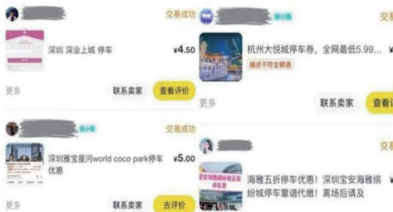
网络上的“代拍”服务

盲盒代拆直播间之所以能够吸引大量观众并促成高频次的购买行为,很大程度上得益于其巧妙设计的商业模式,