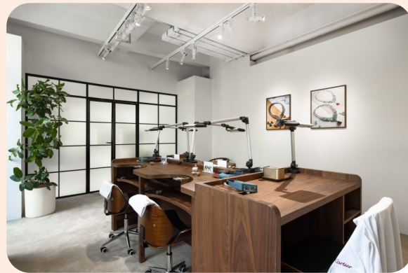
高级珠宝工艺演示及大师课堂