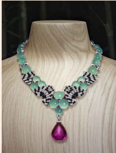
全新卡地亚NATURE SAUVAGE高级珠宝系列CHRYSEIS项链