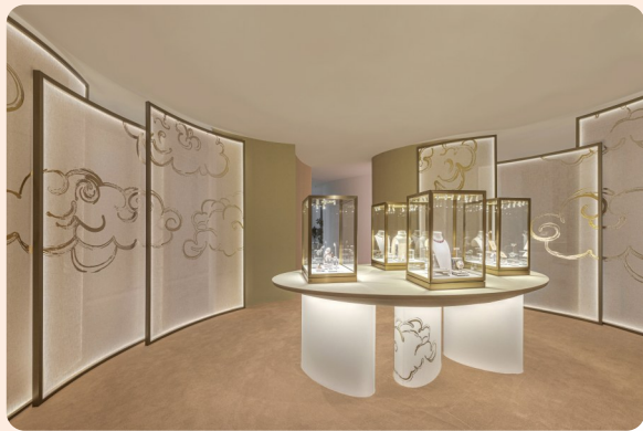
卡地亚古董珍藏系列展区