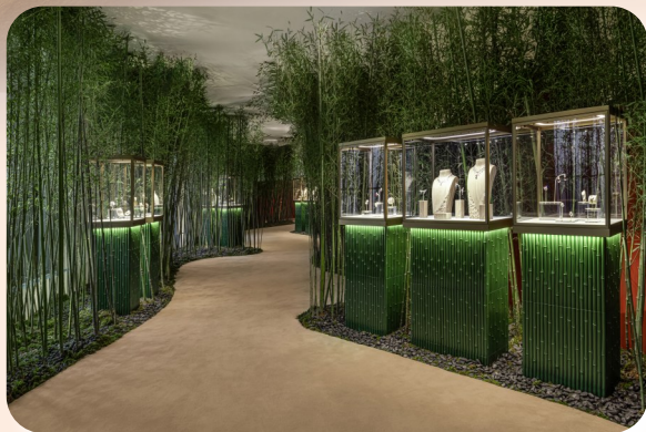
“旷野临风”主题展区