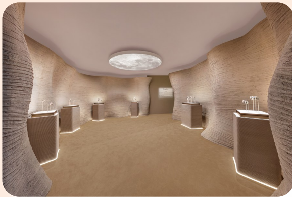
高级制表及高级珠宝腕表展区