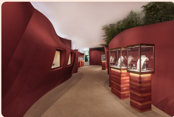
“大地瑰宝”主题展区