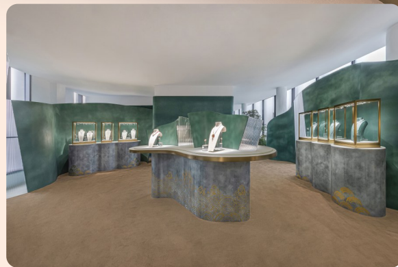
“流水形意”主题展区