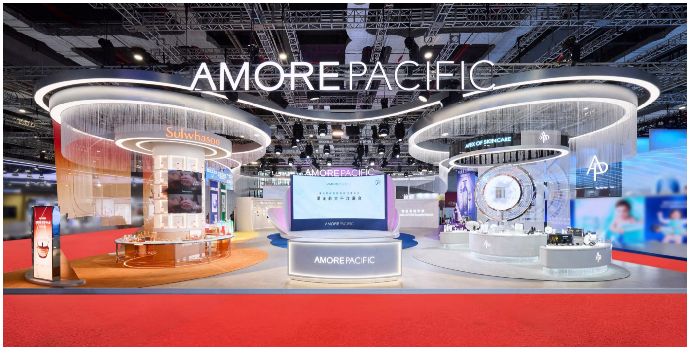
爱茉莉太平洋第七届进博会展台