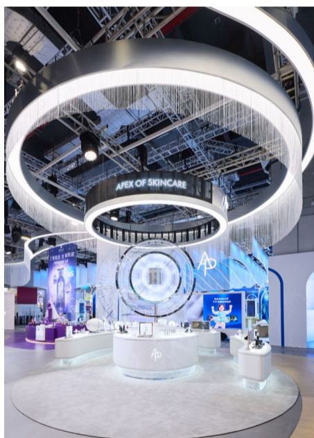
爱茉莉太平洋展台品牌展区 AP 媛彬