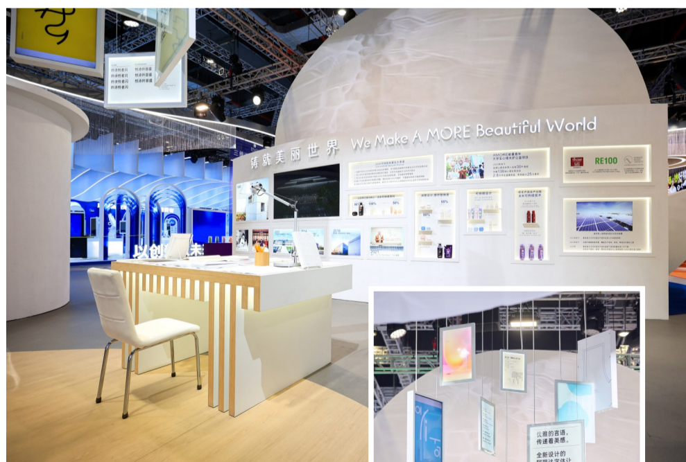
爱茉莉太平洋展台展区-与华成长及可持续发展区