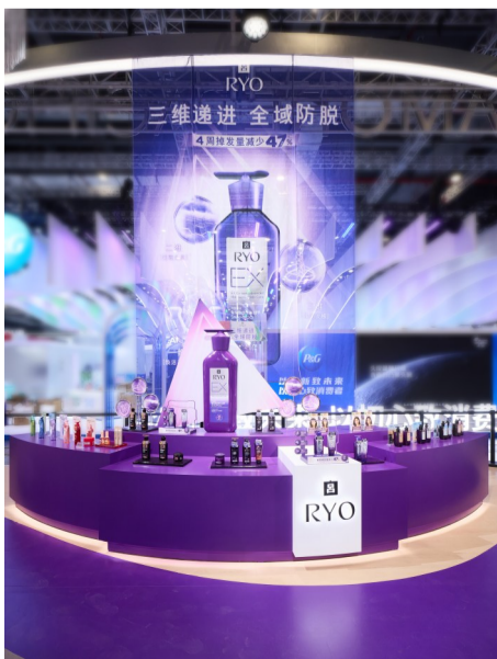
爱茉莉太平洋展台品牌展区 吕