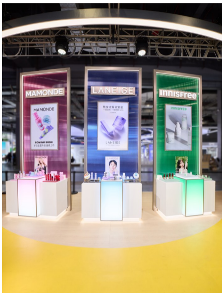
爱茉莉太平洋展台品牌展区 梦妆、兰芝、悦诗风吟