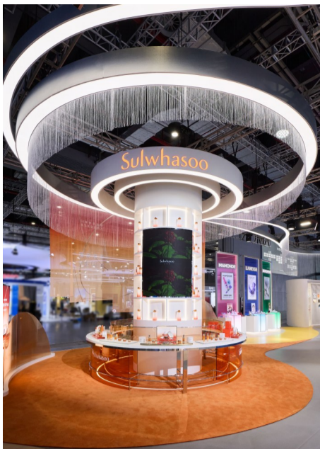
爱茉莉太平洋展台品牌展区 雪花秀