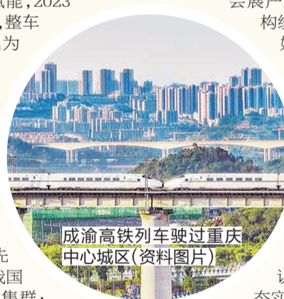
成渝高铁列车驶过重庆中心城区(资料图片)