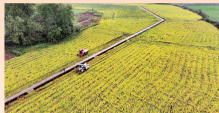
垫江县,农民驾驶收割机收获再生稻。