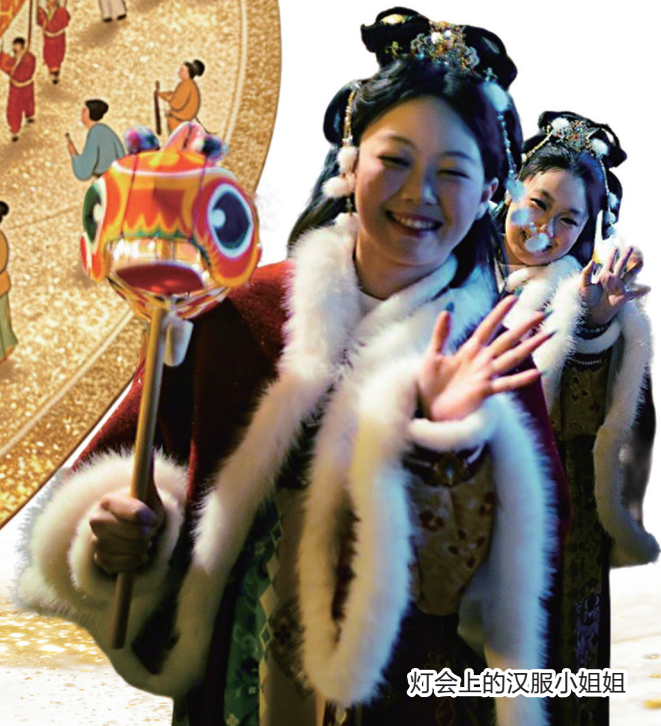
灯会上的汉服小姐姐